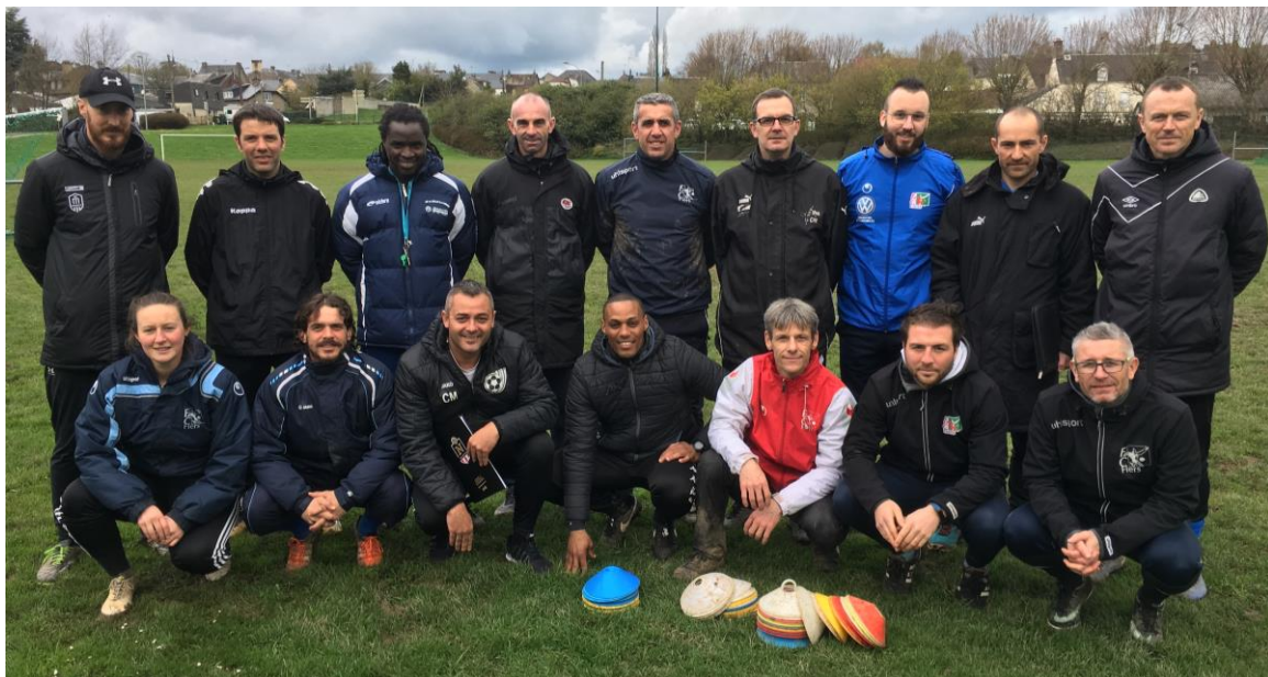
Les stagiaires de la formation