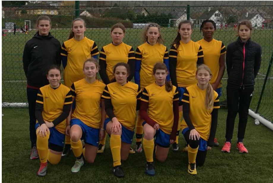
Le groupe Jaune